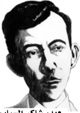
• بدر شاكر السياب