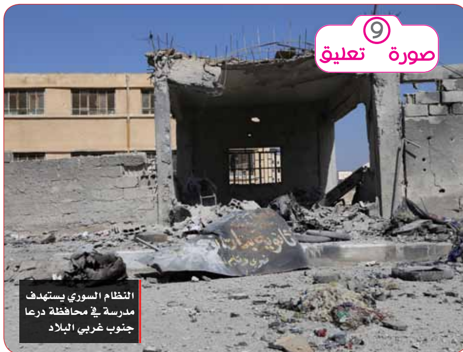
التظام السوري يستهدف مدرسة في محافظة درعا جنوب غربي البلاد

مايزال الناس يتألون من ارتفاع فوائير الكهرباء المبالغ فيها في هذا الصيف. والكل يتساءل عن سبب هذا الارتفاع المفاجيء. البعض يذهب لإدارات الكهرباء فلا يعود إلا بإحباط أكبر. ارحموا الناس في هذا الصيف..