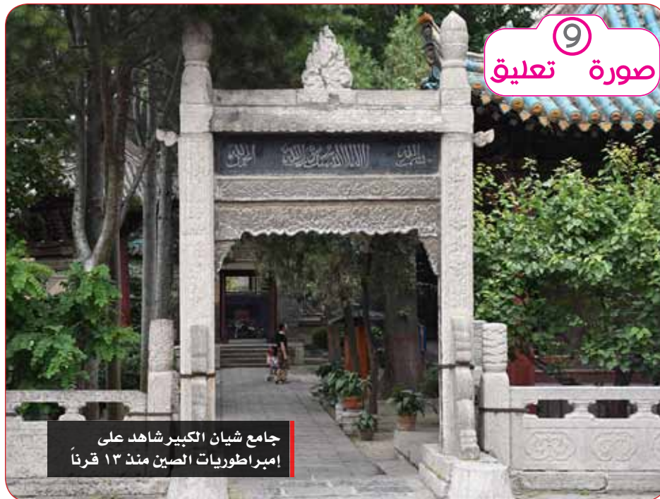
جامع شيان الكبير شاهد على إمبراطوريات الصين منذ ١٣ قرناً